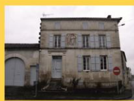
7 - Maison inachevée