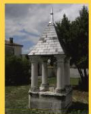
6 - Puits de l'école