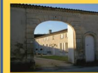
12 - Porche plein cintre