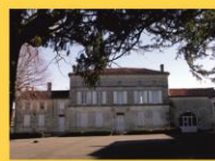
8 - Ecole Maison saintongeaise