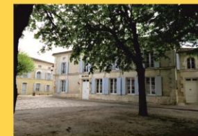
1 - Mairie - ancienne école