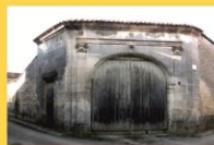
5 - Porche en angle