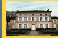
14 - Maison saintongeaise