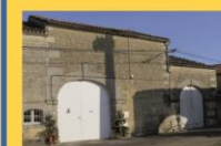
15 - Succession de porches