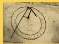
9 - Cadran solaire 1847