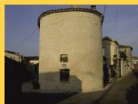
4 - Maison tour