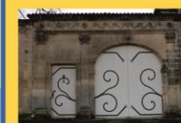
13 - Porche sculpté