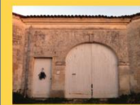
10 - Porche plein cintre