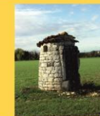
16 - Puits monplaisir