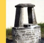
11 - Puits collectif